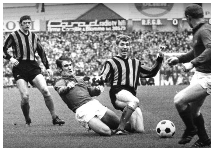
Voor Club Brugge actief tegen Wilfried van Moer van Standard Luik.