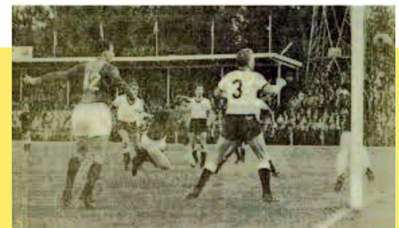
Scorend voor Intertoto tegen Borussia Neunkirchen.