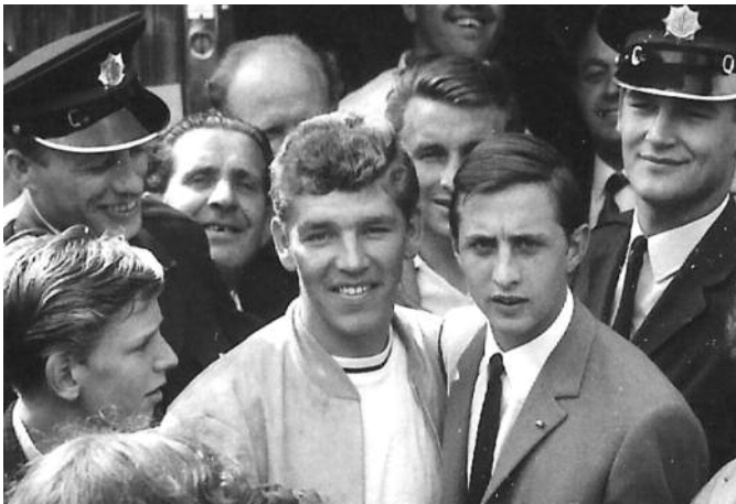
Het moment, waarop de band met Johan Cruyff ontstond.