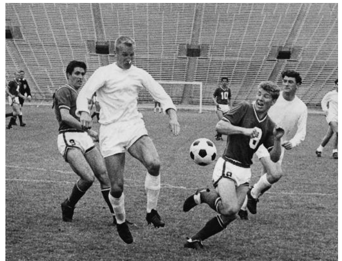
In Amerika tegen Sunderland.

kwamen bij het Nederlands elftal, waar ik drie keer reserve zat en eenmaal mocht meedoen’. Amerika, 1967? ‘Jaja, de mooiste reis van mijn leven. Met ADO spelen in alle grote Amerikaanse steden tegen bekende Europese en Zuid-Amerikaanse clubs. Ik verkeerde in grote vorm toen. Werd met negen doelpunten topscorer van dat toernooi daar. Samen met Roberto Boninsegna, die toen voor Cagliari speelde. Ja, ik beleefde het werkelijk als een droom. Niet alleen voetballen, maar die grote steden bezoeken als New York, Houston, Dallas en San Francisco, dat de thuishaven van ADO was. ADO van toen, onder Happel. Zo mooi, niet uit te leggen, man.’