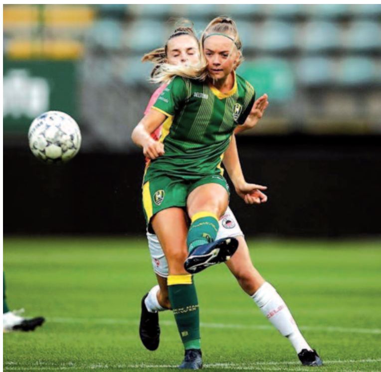
Beeld uit ADO Den Haag vrouwen tegen Excelsior.