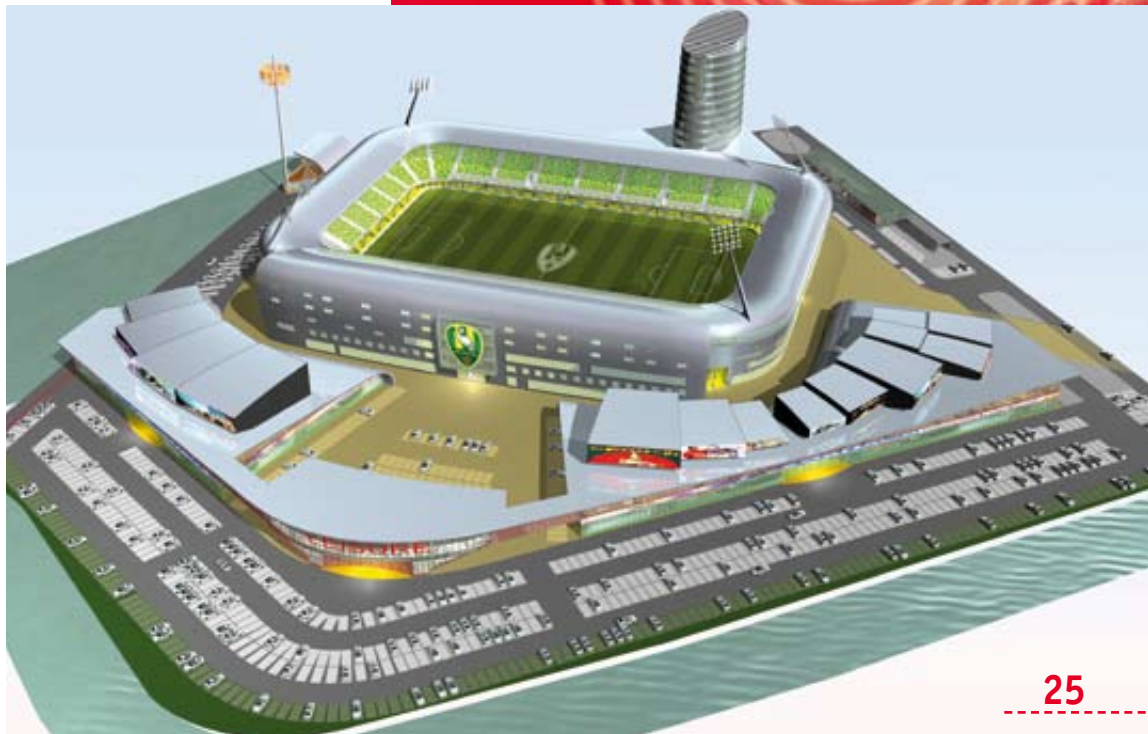
Het nieuwe ADO-stadion in het Forepark.

Om te zorgen dat de politie de openbare orde ook rond het nieuwe ADO-stadion straks adequaat kan handhaven, zijn de beide voetbalinspecteurs nauw betrokken bij de ontwikkeling van de veiligheidsmaatregelen rond het nieuwe stadion. “We denken mee over de manier waarop uit-supporters straks aankomen en na de wedstrijd weer kunnen vertrekken en over de camerabeveiliging. In het stadion komt een moderne commandoruimte (kleine meldkamer), een oploophok en een politie/OM-kamer