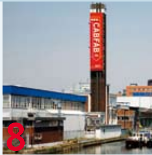
Caballero Fabriek 8