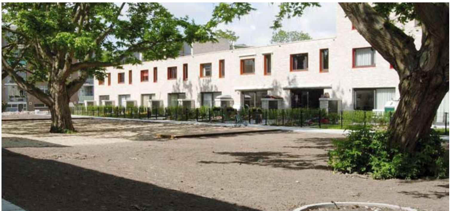
Niet alle genomineerde projecten zijn te zien, omdat sommigen nog in de opstartfase zitten. Hier zijn in ieder geval te zien: Masemude, Park Crayenburch en De Vleugelnoten, Den Haag (hierboven).

De WoonAward wordt jaarlijks uitgereikt aan bouwprojecten in de regio Haaglanden. Het speelde zich dit jaar af rond het thema 'inbreiding': (ver)nieuwbouw binnen de bestaande stedelijke bebouwing. Om in aanmerking te komen voor een nominatie moest het project bestaan uit woningen, woonblokken of een woonomgeving van niet meer dan vijftig woningen. Bovendien golden er criteria als uitzonderlijke kwaliteit, waardering van (toekomstige) bewoners en duurzaamheid. ■