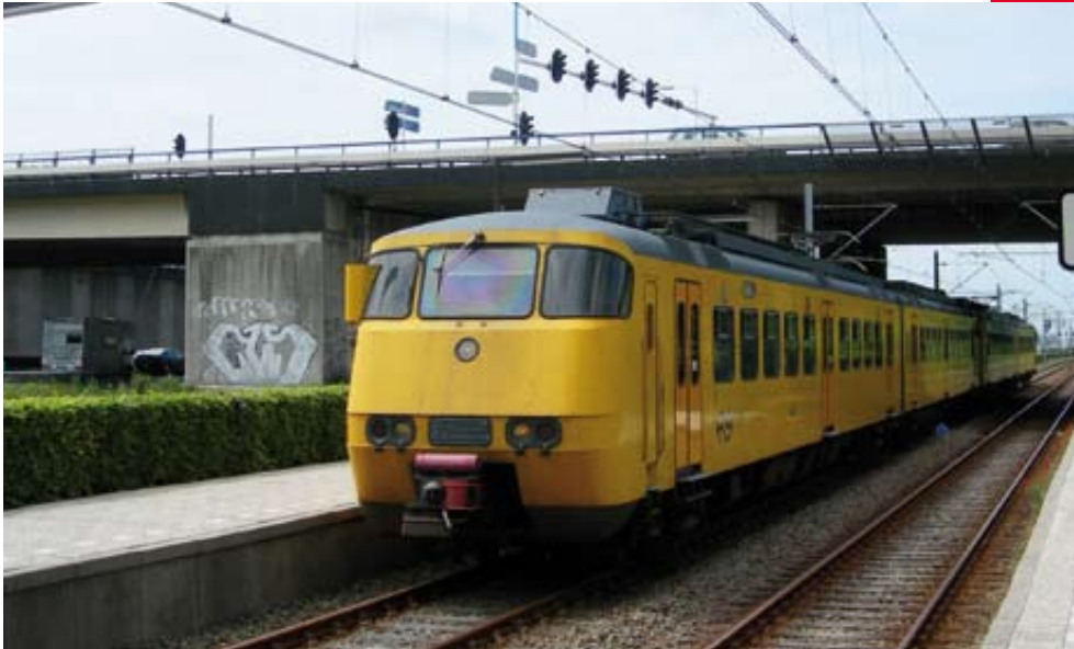
Na bijna dertig jaar trouwe dienst reed de Sprinter in juni voor de laatste keer over de 'krakeling' tussen Den Haag en Zoetermeer.