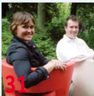
Sport Business Club 31