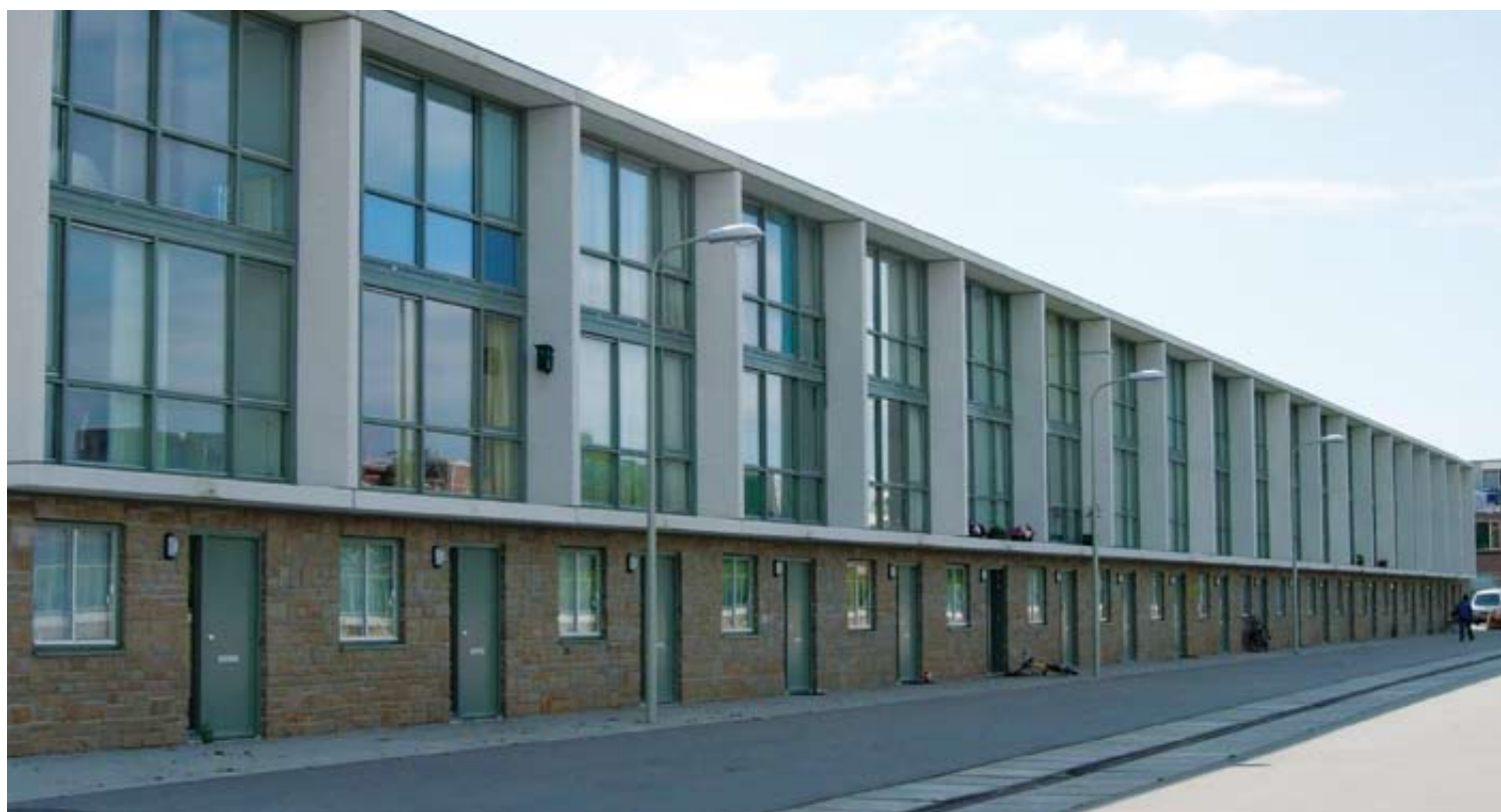
De 'Hof der Verademing' aan de Gaslaan in Den Haag is de winnaar van de WoonAward Haaglanden 2006.

H et project 'Hof der Verademing', gelegen op het voormalige gasfabriekterrein aan de Gaslaan in Den Haag, kwam tot stand onder leiding van projectontwikkelaar AM en is ontworpen door architect Pierre Gautier Architecture. De jury omschreef het ontwerp als: 'Écht een verademing en een sober, duidelijk en open karakter'. De juryleden prezen de manier waarop de ontwikkelaar de bestaande bodemvervuiling en de heersende sociale onveiligheid in de buurt geïntegreerd heeft aangepakt.