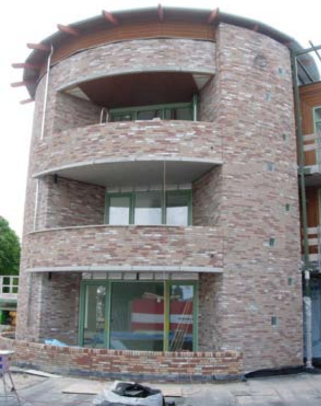
De 'kop' van het Masemude-complex, Monster.

park. En de kleuren van kozijnen en metselsteen sluiten weer aan op de kleuren van de naald en bast van de Libanese ceders die er zijn aangeplant.