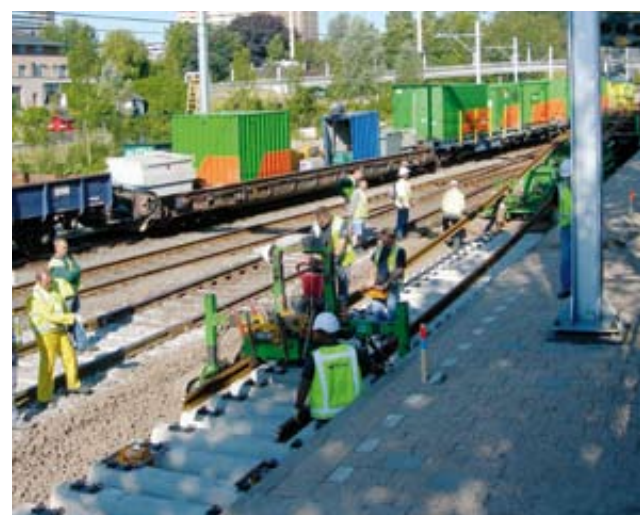
Tijdens de treinvrije periode van de afgelopen zomer werd gelijk 36 km spoor van de Zoetermeertlijn vervangen. Een megaklus!