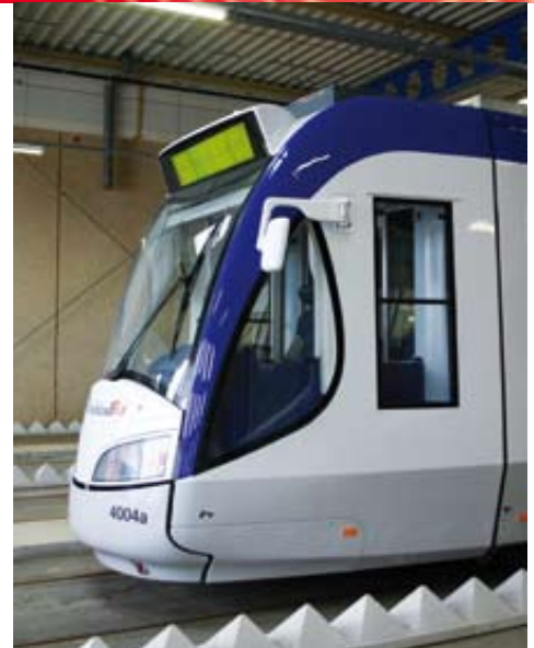
De sneltram van RandstadRail.