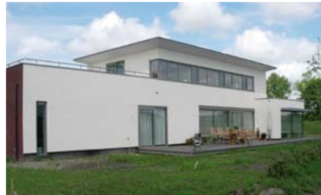
Park Craeyenburch, Nootdorp.