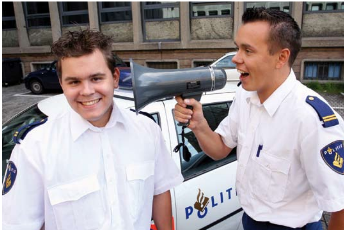
Het politiekorps Haaglanden startte onlangs de campagne 'Laat wat van je horen'. Centraal staat de communicatie met de burgers.